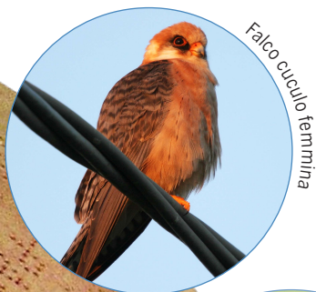
Falco cuculo femmina