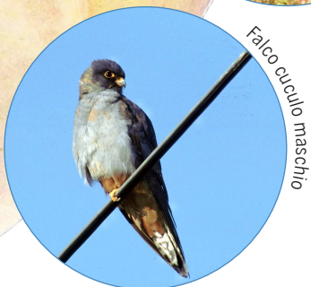
Falco cuculo maschio